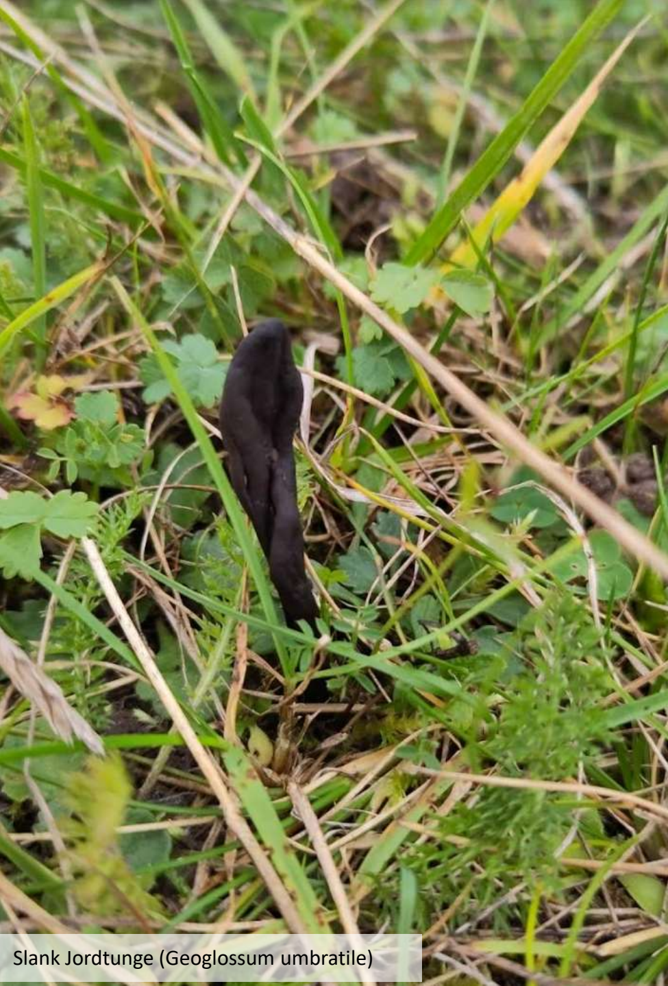
Slank Jordtunge ( Geoglossum umbratile )