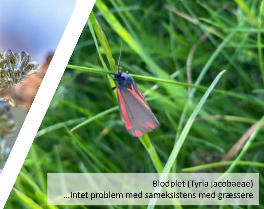
Blodplet ( Tyria jacobaeae ) ...Intet problem med sameksistens med græssere