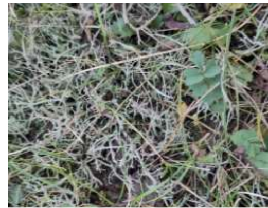
Kløftet Bægerlav ( Cladonia furcata )