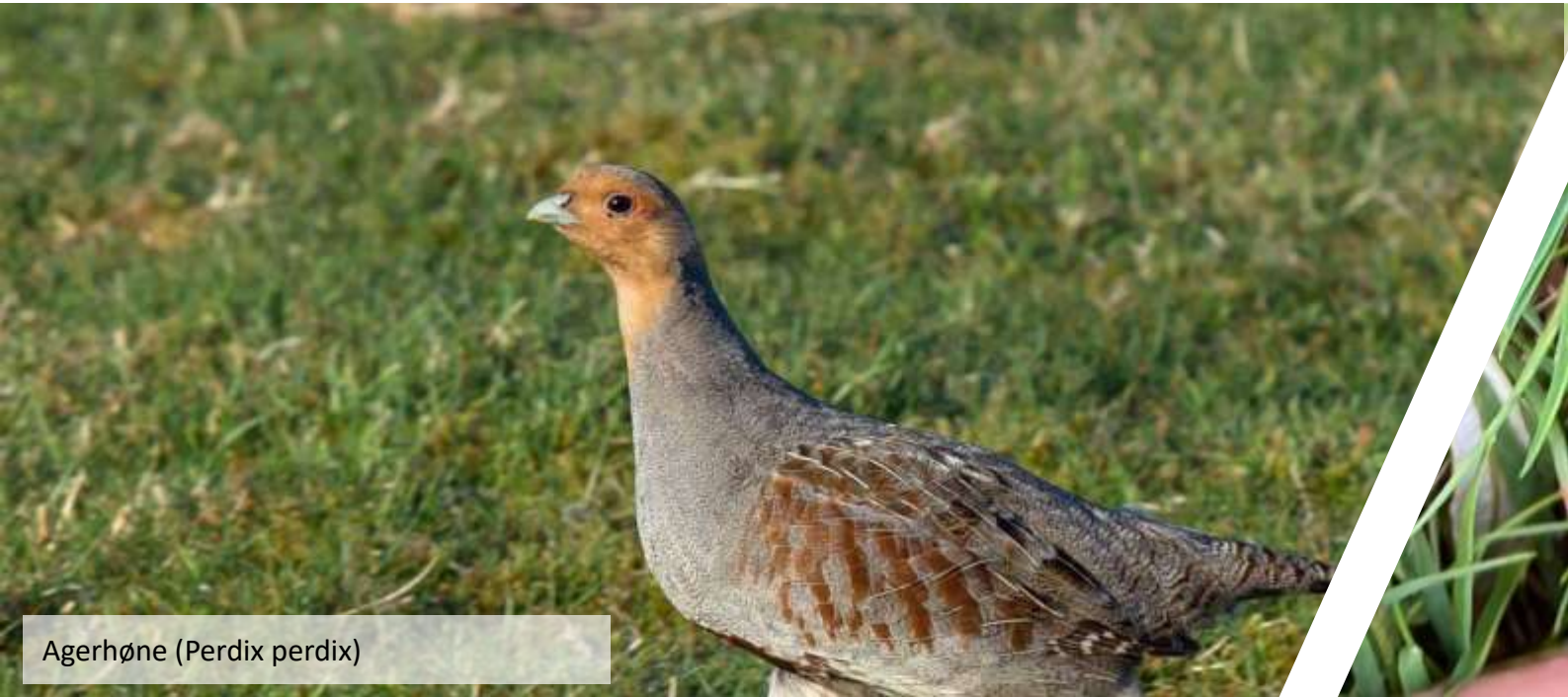
Agerhøne ( Perdix perdix )