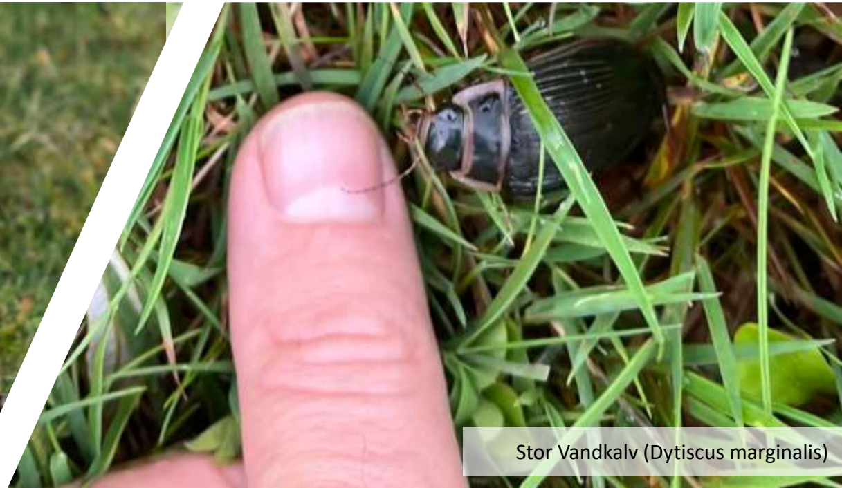
Stor Vandkalv ( Dytiscus marginalis )