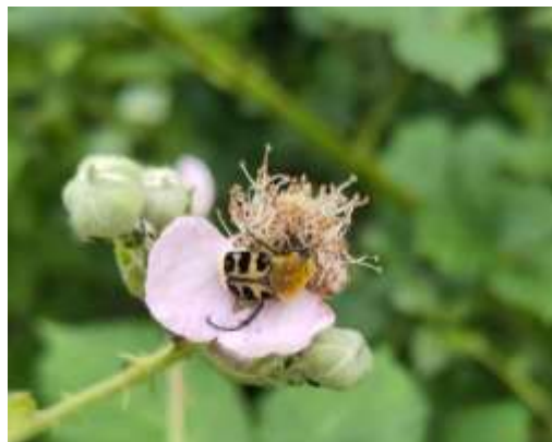
Lille Humlebille ( Trichius rosaceus )