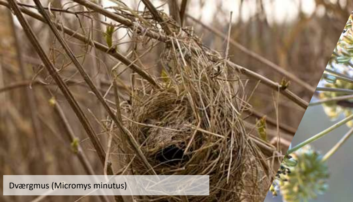
Dværgmus ( Micromys minutus )