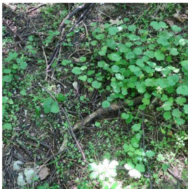
Foto af unge planter af kæmpe-bjørneklo