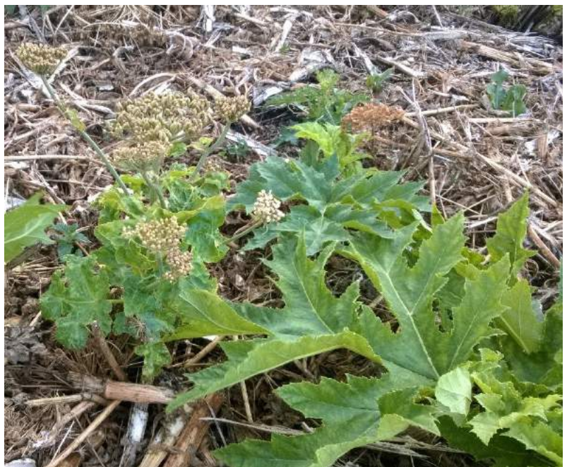
Foto af kæmpe-bjørneklo, som er blevet slået med maskine men efterfølgende er blomstret og som nu har sat frø

I den tidligere indsatsplan blev slåning også anbefalet. På baggrund af erfaring fra den foregående indsatsplan kan det dog konkluderes, at slåning ikke er effektivt, da planterne ikke dør.