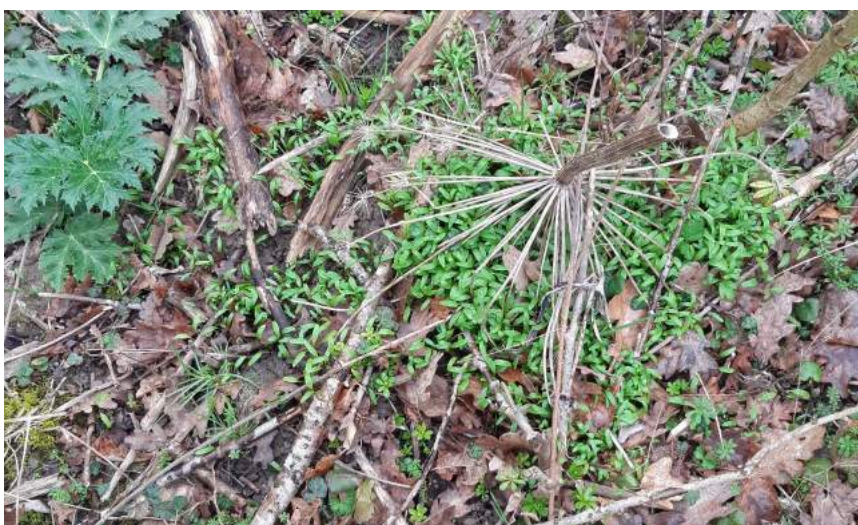
Foto af skærmpapning hvor frøene er modnet videre på jorden

Hvis man ønsker at foretage skærmpapning, skal det foretages, når alle frøene på planterne er grønne men endnu ikke brune. De afkappede skærme skal indsamles i en pose og kan bortskaffes som almindeligt husholdningsaffald eller på genbrugspladser i Roskilde Kommune. Skærmene må ikke smides på kompostbunken.