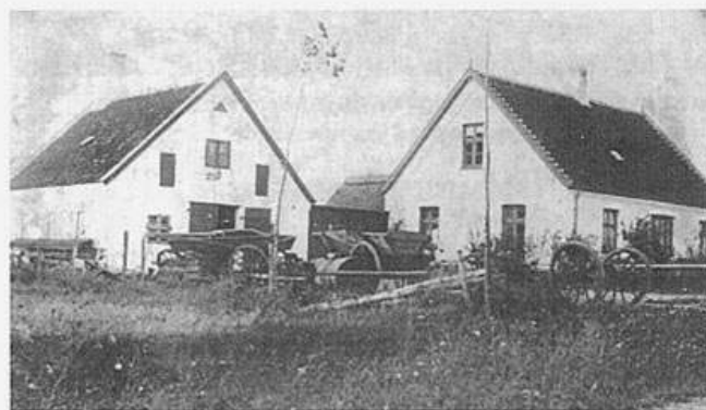
Den nye smedje i Himmelev, 300 meter syd for Hyrehuset.